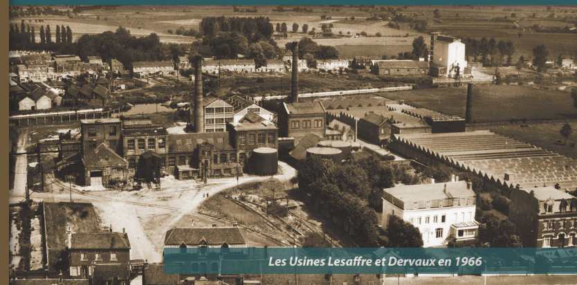
Les Usines Lesaffre et Dervaux en 1966