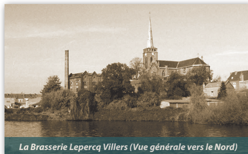
La Brasserie Lepercq Villers (Vue générale vers le Nord)

La brasserie Lepercq Villers s'installe en 1892 au 2 rue Pasteur dans les locaux d'une ferme. Son activité consiste à broyer les grains de céréales, qui viennent pour partie de Flandre, pour ensuite les mélanger à de l'eau et accompagner la fermentation. Les locaux se composent d'une salle de séchage pour les cônes de houblons et de pièces abritant les différentes machines nécessaires à la fabrication : concasseurs, chaudières, cuves à fermentation... De taille modeste, elle emploie 2 à 5 ouvriers, à l'image de la plupart des brasseries de la région.