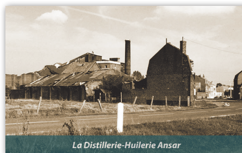
La Distillerie-Huilerie Ansar