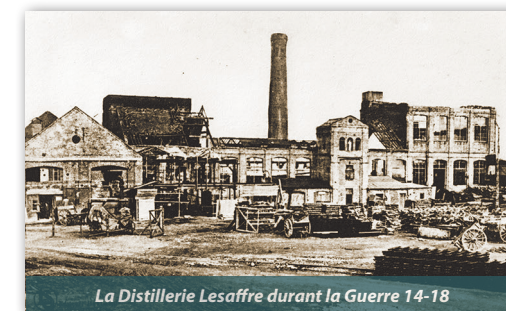
La Distillerie Lesaffre durant la Guerre 14-18

La distillerie Lesaffre œuvre dans le secteur de l'épuration de vinasses et de la récupération de leur azote. En raison même de son activité, elle se trouve soumise à autorisation au titre d'établissement dangereux et insalubre.